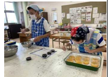
↑ゼリー作り 清掃活動↓