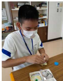
クルミボタン マグネット作り →