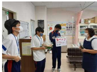
↑商品説明を丁寧に言い、急な質問に戸惑ったけど頑張った!