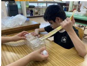
←ペットボトルラベル はがし