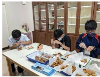
↑クッキー作りと販売準備