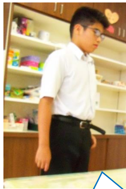
生徒会長あいさつ。明るい中学部にしたいと想いを伝えていました。