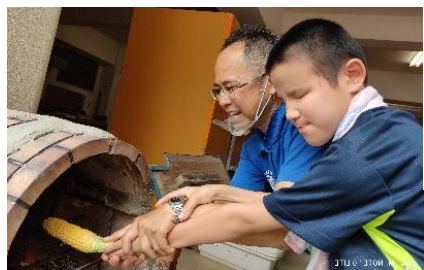
もぎたての焼き トウモロコシ最高～