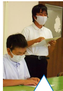
生徒会の仕事について説明している副会長。