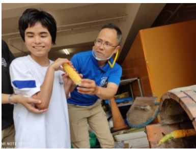
木炭の熱気を感じて後ずさり(°Д°)