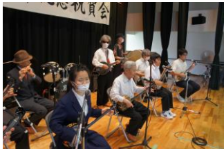
幕開け（沖盲三線クラブ）