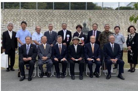
受贈者の皆様(福治の庭)