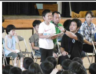
↑代表あいさつや自己紹介が上手!