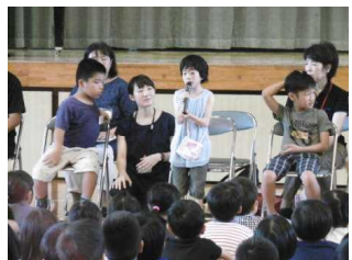
↑全体集会 真地小学校の1～6年生(423人)との交流会に緊張気味でしたが、堂々と元気にあいさつや校歌紹介ができました。