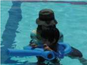
【↑幼稚園と↓中学部のプール学習】

が聞こえてきます。あちらこちらに憩いの場所を見つけました。玄関前にはアンテニウムの花が咲き登下校時にくつろげるイスもあり、下茂橋のほりにはゴールデンシャワーが満開で、