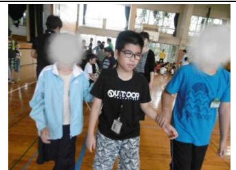
↑お友達と教室へ、嬉しいね