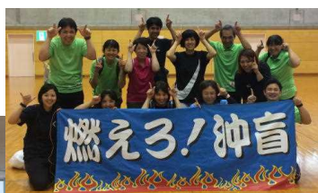
沖縄県特別支援学校 PTA 交流スポーツ大会 ↑チーム沖盲→