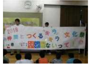
【↑素敵なテーマ横断幕】