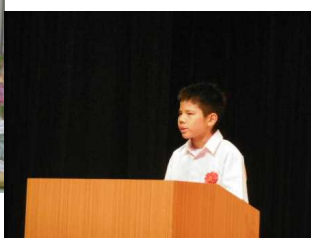
↑司会も無事終わり、翔&咲さん、先生方のこの笑顔！