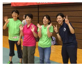
↑レディス応援団 多くの方が参加し、盛り上げていただき感謝！