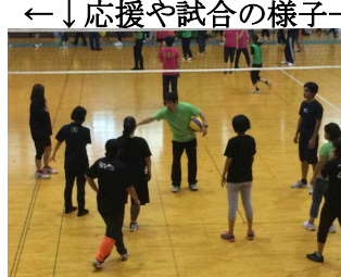
←↓応援や試合の様子→↓