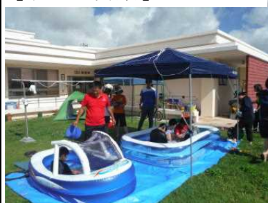
↑大きなプールで楽しく水遊び。水鉄砲で水をかけたりかき氷を食べました。