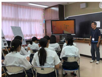
↑「沖盲ふれ eye デー」でアイマスク歩行や視覚障害者卓球他を紹介