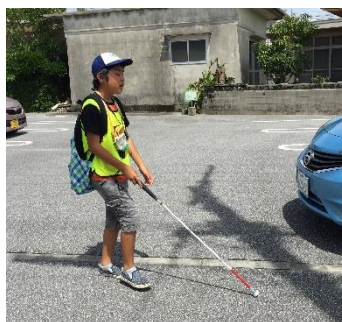
まっすぐまっすぐ…暑いなあ。