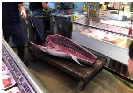
マグロって、大きいなあ！

泊「いゆまち」へ行き、マグロの解体見学や鮮魚の触察をしました。その後、国際通りから平和通りまで歩き、路線バスを使って帰校しました。後日の発表では、「魚の匂いがくさかった」と話したり、外食メニューを発表したりと五感で感じ経験を広げることができたようです。