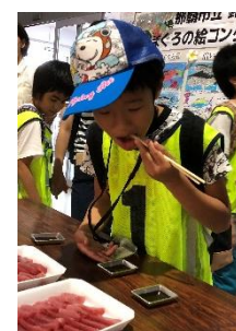
試食も頂きました！