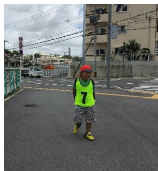
初めてのウォークラリーでうきうき☆

学校周辺や学校から自宅までの道のりを徒歩や路線バスで、白杖段階前の歩行学習や白杖を使用しての歩行学習を行いました。日差しが強く暑い中、汗をかきながら真剣に取り組む子どもたちの姿に指導する側も気が引き締まります。