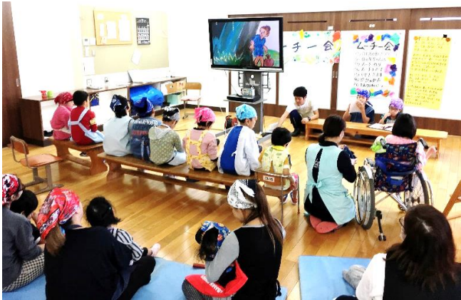
5年生が「鬼ムーチー」の絵本を 読み聞かせてくれました。